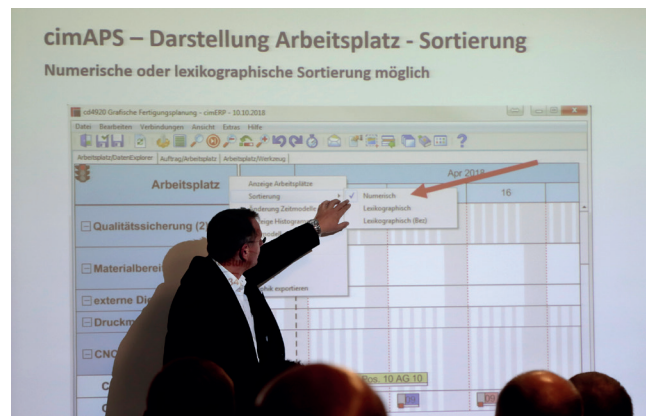
Vortrag cimAPS am IT Forum

Mehr Informationen zur Veranstaltung finden Sie auf unserer Website.